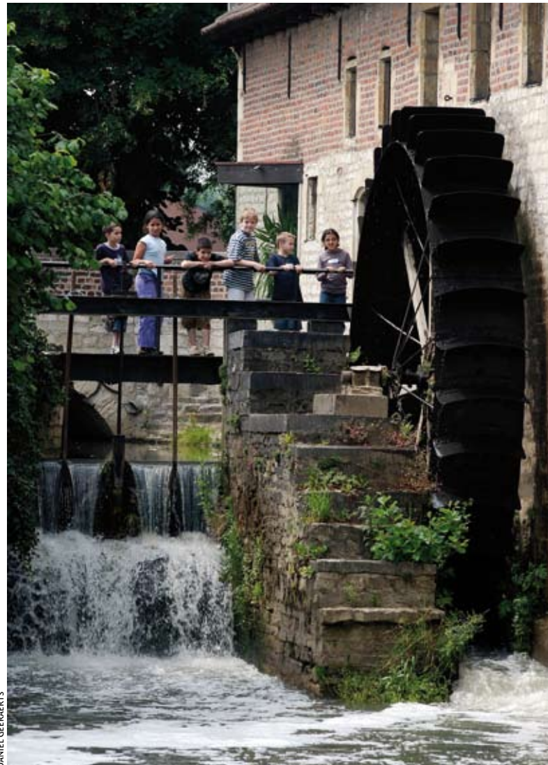
Musea doen nu al veel moeite om voor jongeren de drempel te verlagen.

Voor het lokale erfgoedbeleid is een cultureel-erfgoedconvenant een must om van Vlaamse ondersteuning te genieten. Een mooi instrument dat mooie resultaten oplevert. Extra middelen moeten dan ook worden gereserveerd om de groei te bestendigen en eventueel te versterken. Bovendien vraagt de VVSG extra stimulansen voor intergemeentelijke samenwerkingen zodat ook kleine gemeenten dit instrument kunnen