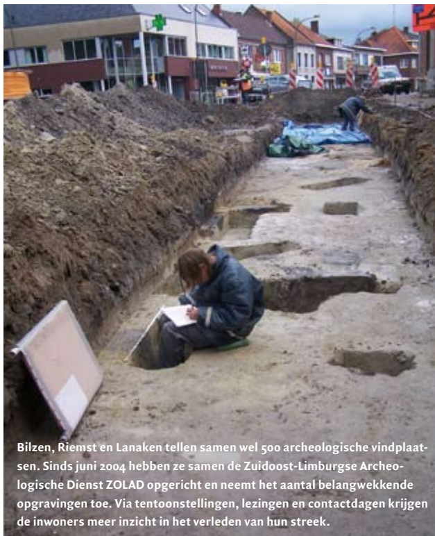
Bilzen, Riemst en Lanaken tellen samen wel 500 archeologische vindplaatsen. Sinds juni 2004 hebben ze samen de Zuidoost-Limburgse Archeologische Dienst ZOLAD opgericht en neemt het aantal belangwekkende opgravingen toe. Via tentoonstellingen, lezingen en contactdagen krijgen de inwoners meer inzicht in het verleden van hun streek.

Vlaams minister Dirk Van Mechelen om te starten met intergemeentelijke onroerend-erfgoeddiensten.