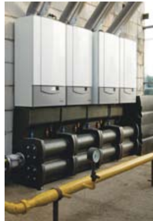
1. Remeha QUINTA. Vermogen van afgebeelde opstelling: 336 kW